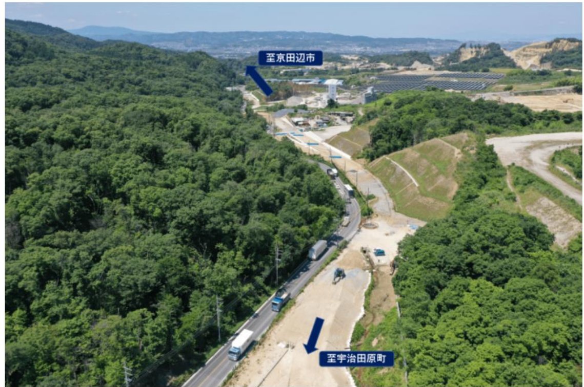
国道307号（城陽市市辺～奈島）

また、当該路線は平成35年供用予定の新名神高速道路の（仮称）宇治田原インターチェンジへのアクセス道路としても大いに期待されております。